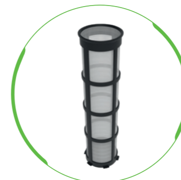
Filtereinsatz für die Varianten pureliQ:K und KD