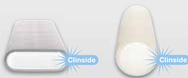
Zehnder ComfoTube flat 51 / ComfoTube