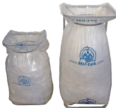
125 L, 240 L Folien Sammler