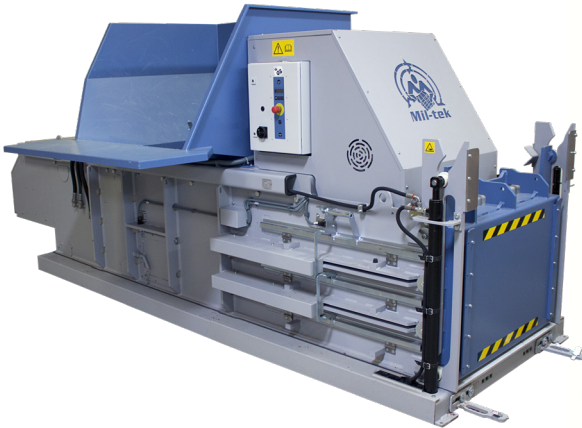
HZT600 Industrielle horizontale Presse