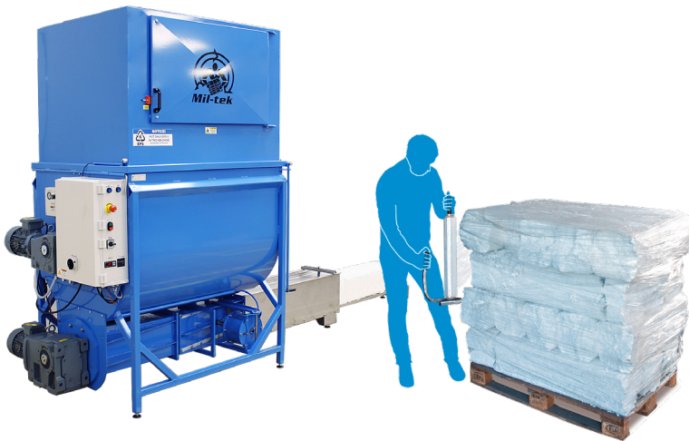
EPS1000, EPS2000 Styropor und XPS Pressen