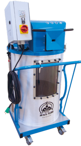
Band Cliper Band Schneidmaschine