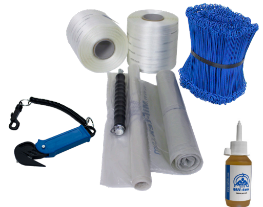
Verbrauchsmaterialien All in One