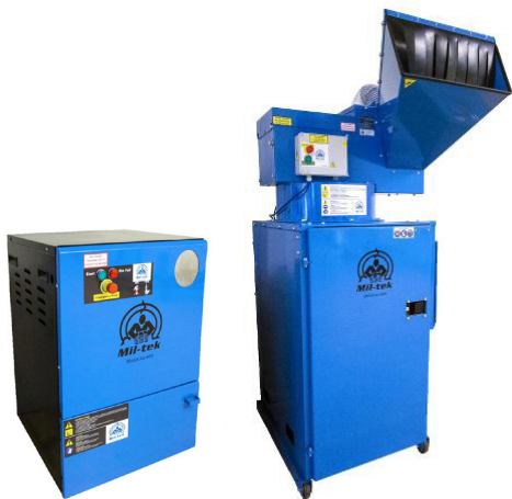
GC100, GC100T, GC600 Glasszerkleinerer